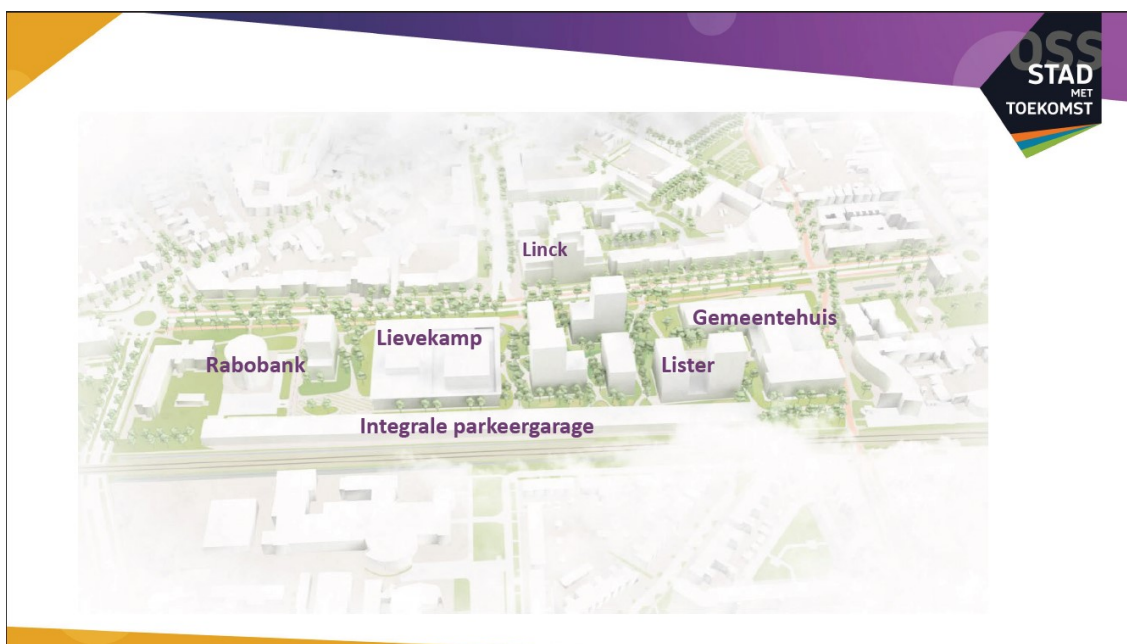
Deze afbeelding laat de toekomstige situatie in het gebied zien (Visie Raadhuislaan): De Lievekamp die straks is uitgebreid; de integrale parkeervoorziening aan de spoorzijde, de ontwikkeling van Lister (bevindt zich nog in de planfase), en het gemeentehuis. Aan de Noorzijde is de ontwikkeling 'Linck' zichtbaar, op de plaats van het voormalige Belastingkantoor.