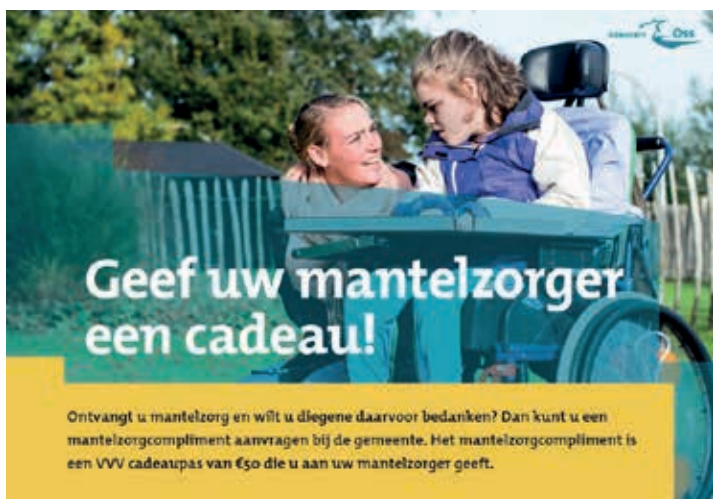
Ontvangt u mantelzorg en wilt u diegene daarvoor bedanken? Dan kunt u een mantelzorgcompliment aanvragen bij de gemeente. Het mantelzorgcompliment is een VVV cadeaukaart van €50 die u aan uw mantelzorgverlener geeft.

Een mantelzorgverlener zorgt langdurig en onbetaald voor een naaste met een ziekte of beperking. Meestal is een mantelzorgverlener een familielid, vriend of kennis. Mantelzorg kan zijn: huishoudelijke hulp, toezicht en gezelschap, begeleiding bij het vervoer of de administratie. Maar er zijn ook mantelzorgverleneren die helpen bij het douchen, aankleden en naar de wc gaan.