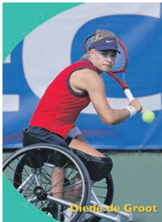
Diede de Groot