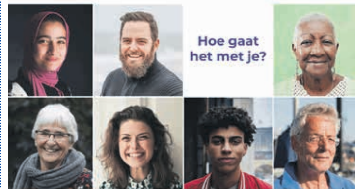
Hoe gaat het met je?